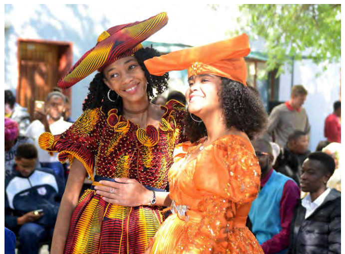
Zwei TUCSIN Studentinnen bei einer Vorführung am 11. Juni 2018