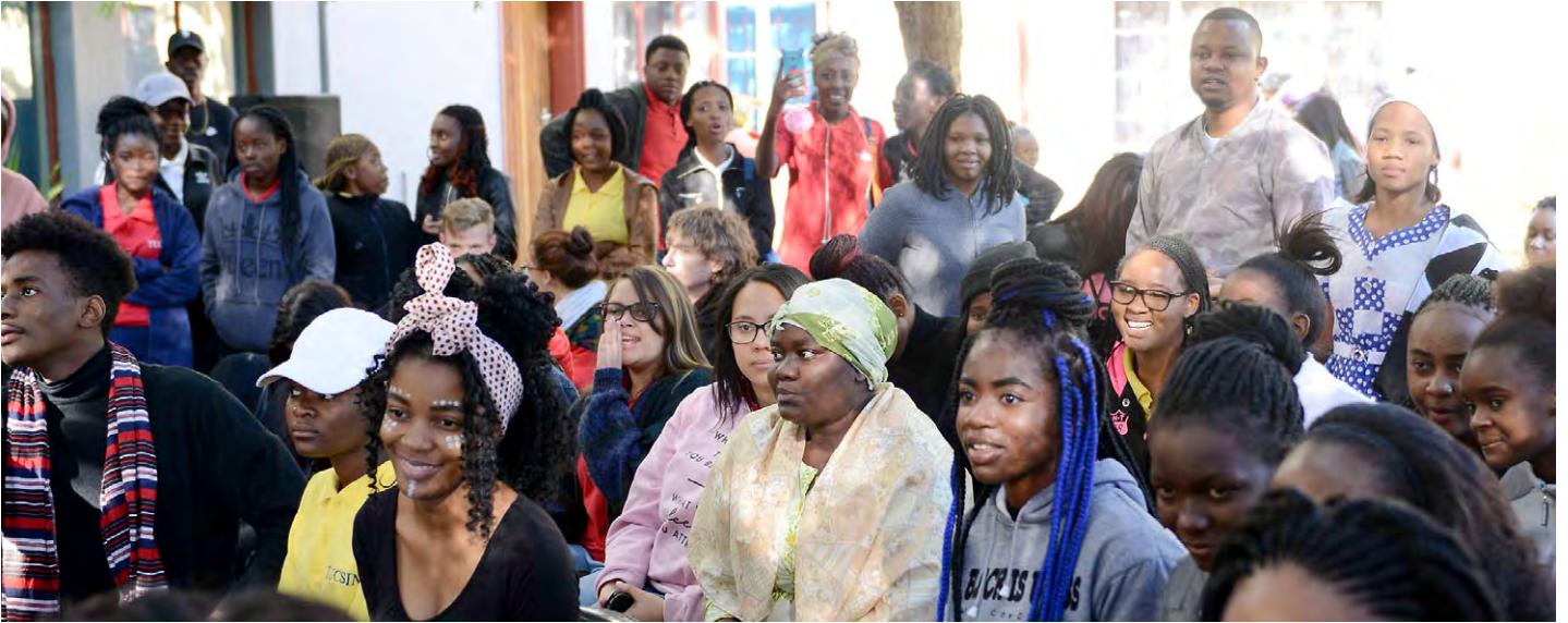
40 Jahre TUCSIN: TUCSIN-Studenten als Akteure und Publikum, 11. Juni 2018