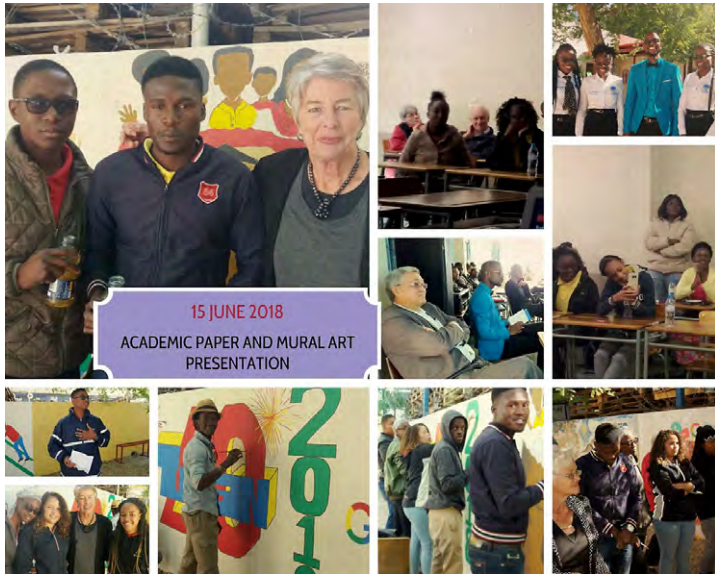
40 Jahre TUCSIN: Kunstaktionen und Vorträge

Ähnlich der schwachen Ökonomie Namibias, die noch dazu von einer Dürre erschwert wird, verfestigte sich 2018 der rückläufige Trend der Studentenzahlen in den vier Zentren Oshakati, Rundu, Windhoek-Zentrum und Windhoek-Khomasdal auf 832 Teilnehmer, die von 52 meist Teilzeit-Lehrkräften unterrichtet wurden. Die Ergebnisse waren überwiegend gut bis sehr gut. Eine Mehrheit der Absolventen verbesserte so ihren Einstieg ins Berufsleben, etwa ein Drittel bewarb sich an tertiären Bildungseinrichtungen.