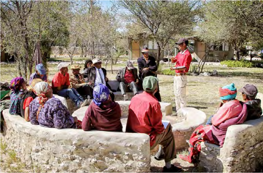
TUCSIN Tsumkwe Mitte Juni: Die Tagung des Ältestenrates wurde im Radio übertragen.

der heutigen Zeit für Ju/'hoansi Kinder und Jugendliche wesentlich sind, damit sie gestärkt sich der Moderne stellen können und auch Stolz auf sich entwickeln. Diese bemerkenswerte Gruppe von 12 Älteren setzte mich erneut in Erstaunen: Diese Weisheit, ihre Beiträge Probleme zu lösen und ihr kritisches Denken wären auch wertvoll für jedes Erziehungswesen der sog. entwickelten Welt. Die ganze Tagung wurde live im Radio gesendet und ich weiß, die Community wird noch lange darüber am Feuer sprechen.“